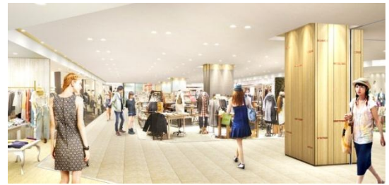
【3階ファッションフロア・イメージ】

KOFU HARE LIFE を充実させる衣・食・住の MDをバランスよく展開したフロア構成により 日々の暮らしにちょっぴり豊かな「コバレ感」 をプレゼントします。