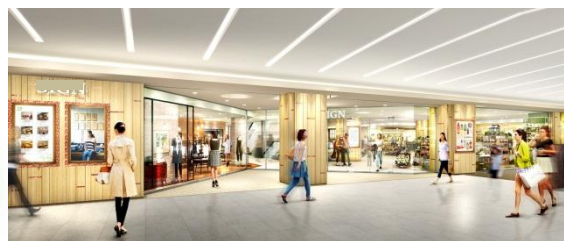
【エントランス・イメージ(2階コンコースより)】

甲府エクランは、山梨県内唯一の駅ビルとして1985年10月に開業し、以来29年に渡り、地域の皆様に支えられて営業を行ってまいりましたが、昨今のお客さまのニーズを踏まえ、「毎日気軽に立ち寄れる心地よさの中にも、都会的エッセンスを感じる駅ビル」として生まれ変わります。ご利用されるお客さまの何気ない毎日に“幸せ＝ハレ”を提供します。