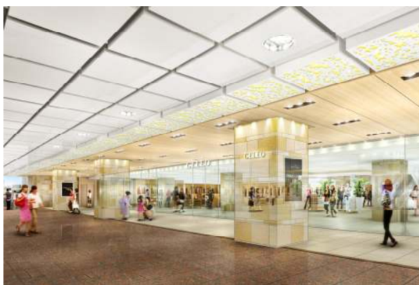
2F コンコースから見たエントランス

オープンに伴い、セレオ八王子で利用ができるセレオポイントカード事前入会キャンペーンを実施いたします。10月5日～10月24日の間に特設カウンターで、セレオポイントカードにご入会いただいた方に、100ポイントをプレゼントいたします。