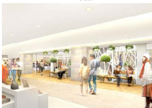
各階エスカレーターまわり